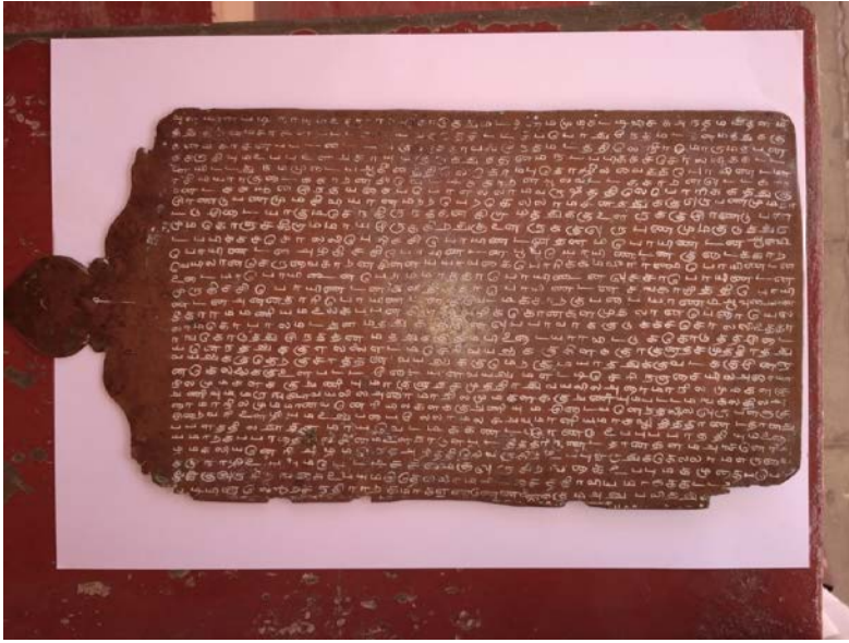
Figure இரண்டாவது ஏடு முன்புறம் (Dr. N. Valli)