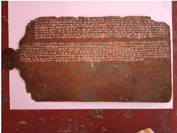
Figure இரண்டாவது ஏடு பின்புறம் (Dr.N.Valli)