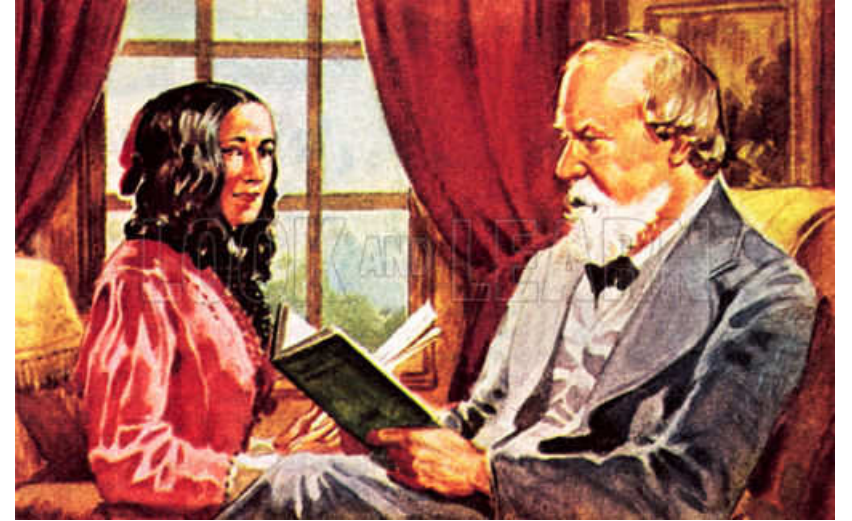
எலிஸபெத் பிரௌனிங்கும் ராபர்ட் பிரௌனிங்கும் முதுமையில்