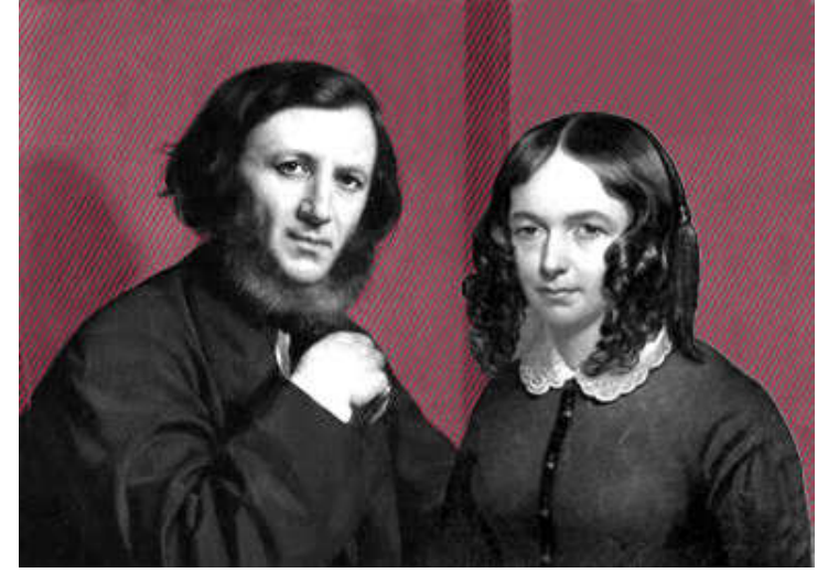
ராபர்ட் பிரௌனிங்கும் எலிஸபெத் பிரௌனிங்கும் இளமையில்